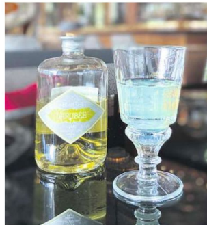
Absinth ist das bläuliche Gold der Region.

Wer Urbanität sucht, wird sie woanders finden, weiter im Süden. Wo die Juraberge in ein sanftes Hügelland übergehen, liegt am gleichnamigen See Neuchâtel. In der Kantonshauptstadt herrscht jene Gelassenheit, die sonst dem Süden Europas vorbehalten ist. Auf den Terrassen der Cafés: Palmen, Stimmengewirr, ein Hauch von Urlaub. Am schönsten sitzt es sich vor dem Hotel Beau-Rivage, einem Prunkbau aus der Belle Époque. Der Blick schweift über einen Park und den See, weit in die Berge hinein. Was es zu trinken gibt? Natürlich Absinth.