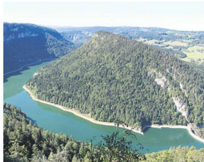
Um die Doubschleife fahren Besucher mit dem Kanu.