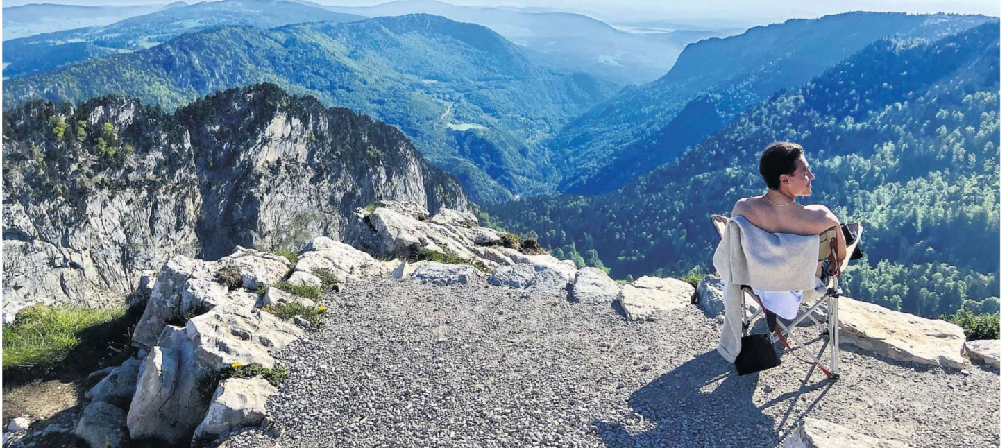
Aussicht auf den Creux du Van, einen natürlichen Felsenkessel mit steilen Wänden.

N ach rechts!, ruft der Kanu-Coach. Eine fabelhafte Idee! Aber wie ging das gleich wieder? Nach vorne oder nach hinten paddeln? Und auf welcher Seite? Zwei Personen im Kanu, zwei Lösungsansätze – das kleine Kanu bekommt Schlagseite und dreht sich einmal um die eigene Achse.