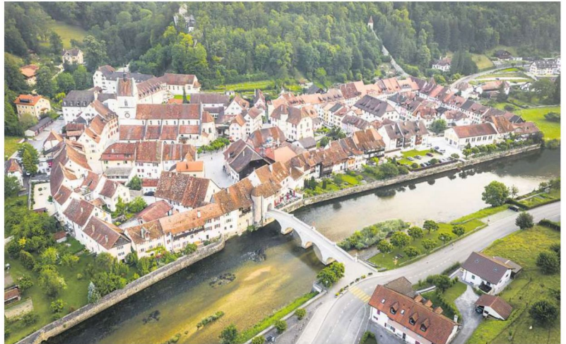
In Saint-Ursanne scheint die Zeit stehen geblieben zu sein.

ihnen wurde die einzige originär Schweizer Pferderasse benannt. Die Tiere wurden im 19. Jahrhundert so gezüchtet, dass sie stark genug für die Feldarbeit, gleichzeitig aber leichter und schneller als andere Pferde waren.