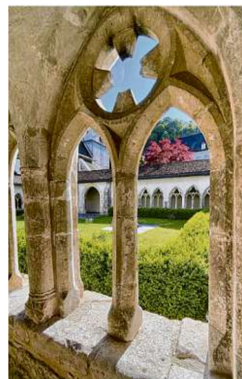
Der Kreuzgang der Stiftskirche von Doubs bildet die Kulisse für Sommerkonzerte.

Das einstige Bergdorf La Chaux-de-Fonds nahm ebenfalls im 19. Jahrhundert eine ungewöhnliche Entwicklung: Hugenottische Einwanderer legten hier die Grundlage für die berühmte Schweizer Uhrenindustrie. „Um 1900 stammte mehr als die Hälfte der weltweiten Uhrenproduktion aus La Chaux-de-Fonds“, berichtet Stadtführer Ruedi Schlaepfer. Bis heute werden hier die exklusivsten und teuersten Modelle gefertigt und es gibt zwei Hochschulen, an denen man das Handwerk erlernen kann. Die gesamte Stadt hatte eine schachbrettartige Struktur erhalten, damit das Sonnenlicht gleichmäßig in die Fenster der